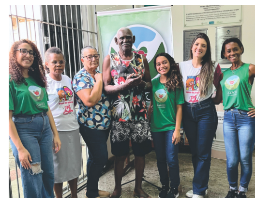
CASA DE ACOLHIMENTO