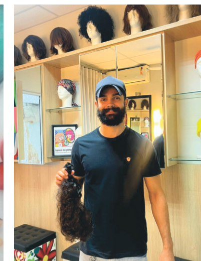
DOAÇÃO DE CABELO