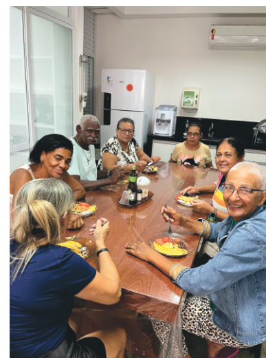
CASA DE ACOLHIMENTO