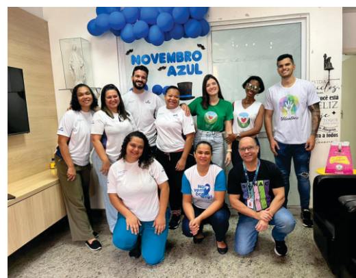
VISITA PROF. ED. ALVES E ALUNOS SENAC