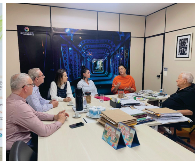
MOVIMENTO COALIZÃO CIDADES NO CONTROLE DO CÂNCER