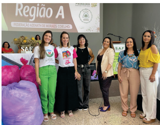
PROJETO ALMOFADAS DO BEM