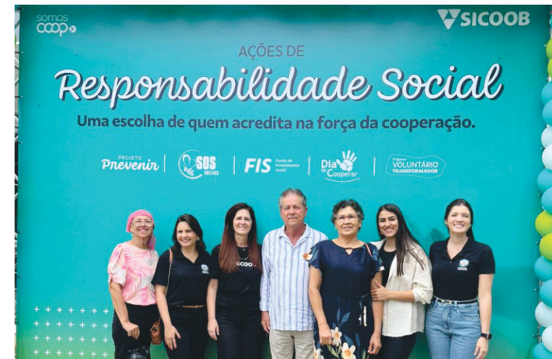
EVENTO SICOOB SUL ES 2025 - AÇÕES DE RESP. SOCIAL