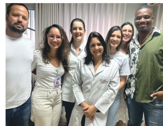
REUNIÃO DE ALINHAMENTO G. APOIO